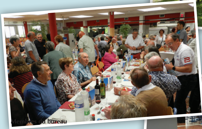
Membres du bureau