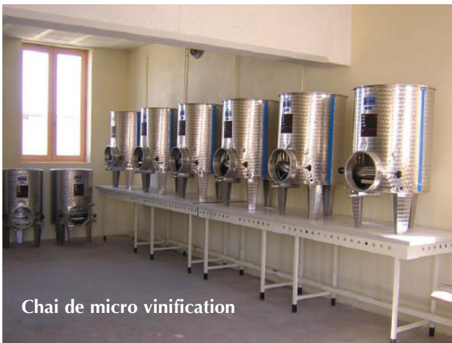
Chai de micro vinification

2021 : Année de gel de printemps après celles de 2017 et 2019 : 90 HL d'AP (Alcool Pur) à commercialiser contre 160 HL d'AP en 2020. Aménagement de la salle des ventes.